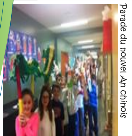
Parade du nouvel An chinois